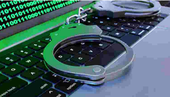
போபால்: மத்திய பிரதேச மாநிலம் போபால்