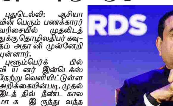
புதுடெல்லி: ஆசியாவின் பெரும் பணக்காரர் வரிசையில் முதலிடத்துக்கு தொழிலதிபர் கவுதம் அதானி முன்னேறியுள்ளார். புனம்பெருக்கில் விய வர் இன்டெக்ஸ் நேற்று வெளியிட்டதுள்ள அறிக்கையின்படி, முதல் இடத்தில் நீண்ட காலமாக இருந்து வந்த முகேஷ் அம்பானியை பின்னுக்குத்தள்ளி கவுதம் அதானி தற்போது ஆசியாவின் மிகப்பெரிய பணக்காரர் உயர்ந்துள்ளார். கவுதம் அதானியின் நிகர சொத்து மதிப்பு 92.6

சரிந்துள்ளார். விக்ரி யாசம் மிகக் குறைவு என்றாலும், இந்த மாற்றம் சந்தையின் தாக்கத்தை தெளிவாக காட்டியுள்ளது. கவுதம் அதானியின் சொத்து மதிப்பு இந்த ஆண்டு மட்டும் 8.1 பில்லியன் டாலர்கள் அதிகரித்துள்ளது. இந்த வளர்ச்சிக்கு அவரது குழு நிறுவனங்களின் பங்கு முக்கிய பங்கு வகிக்கிறது. சந்தையில் சரிவு ஏற்பட்ட நாட்களில் கூட அதானி குழு நிறுவனம் பங்குகள் சிறப்பான முறையில் வளர்ந்து உள்ளது.