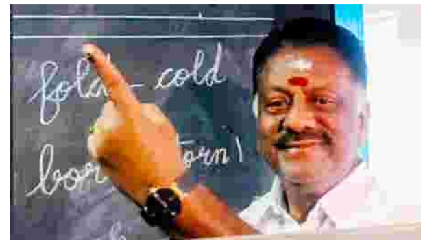
தேனி, ஏப்.24- தேனி மாவட்டம், பெரியகுளம் வடகரை பகுதியில் தனியார் பள்ளியில் அமைக்கப்பட்டிருந்த வாக்குச்சாவுடியில், முன்னாள் முதல்வரும் போடிநாயக்கனார் சட்டமன்றத் தொகுதி திமுக வேட்பாளருமான ஓபன்ன்ர்செல்வம் தனது வாக்கினை பதிவு செய்தார். இதேபோல், முன்னாள் தேனி பாராளுமன்ற உறுப்பினர் ப.ரவீந்திரநாதத்தனது வாக்கினை பதிவு செய்தார். முன்னாள் முதல்வர் ஓ. பன்னீர்செல்வம் செய்தியாளர்கள் சந்திப்பில் தெரிவித்ததாவது: தமிழகத்தில் மதச்சார்பற்ற முற்போக்கு கூட்டணி வெற்றிபெற்று மீண்டும் தமிழக முதல்வராக மு.க.ஸ்டாலின் இரண்டாவது முறையாக பொறுப்பேற்றார். 200க்கும் மேற்பட்ட இடங்களில் மதச்சார்பற்ற முற்போக்கு கூட்டணி வெற்றி பெறும். அனைவரும் ஜனநாயக கடமை ஆற்ற வேண்டும் என்று தெரிவித்தார். இந்த நிகழ்வின் போது திமுக கூட்டணி நிர்வாகிகள் மற்றும் பொறுப்பாளர்கள் என ஏராளமானோர் திரளாக கலந்து கொண்டனர்.