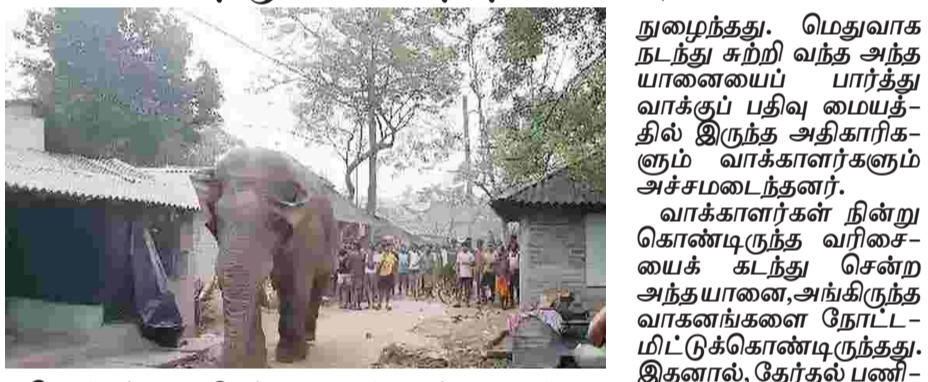
கொல்கத்தா: மேற்கு வங்கத்தின் ஜார்க்கண்டில் அமைக்கப்பட்டிருள்ள வாக்குப்பதிவு மையத்துக்கு காட்டு யானை ஒன்று காலையிலேயே வந்ததால் அதிகாரிகளும் வாக்காளர்களும் அச்சமடைந்தனர். தேர்தல் போட்டி செய்து வரும் வாக்குப்பதிவு மையங்களில் தம் பல்திறமை வாய்ந்த அந்த யானையை பார்த்து வாக்குப்பதிவு மையத்தில் இருந்த அதிகாரிகளும் வாக்காளர்களும் அச்சமடைந்தனர். வாக்காளர்கள் நின்று கொண்டிருந்த வரிசையைக் கடந்து சென்ற அந்த யானை, அங்கிருந்த வாக்காளர்களை நோட்டமிட்டுக் கொண்டிருந்தது. இதனால், தேர்தல் பணிகள் சற்று தாமதமாகின. எனினும், லோதாவுலி சரகத்தில் இருந்து விரைந்து வந்த வந்ததுறை அதிகாரிகள், அந்த யானையை மெதுவாக பாதுகாப்பான தூரத்துக்கு அழைத்துச் சென்றனர். இதையடுத்து, வாக்குப்பதிவு மையம் விரைவாக இயல்பு நிலைக்குத் திரும்பியது.