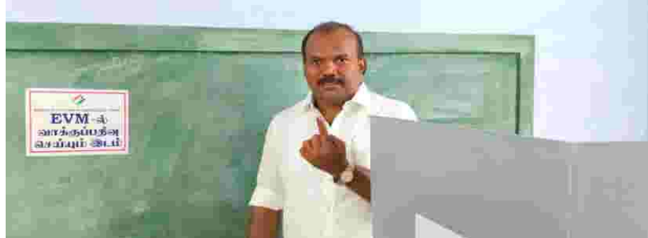
தூத்துக்குடி போல்பேட்டை பகுதியில் உள்ள தங்கம்மாள் மேல்நிலைப்பள்ளியில் அமைக்கப்பட்டுள்ள வாக்குச்சாவுட்கு மாநகராட்சி யேயர் ஜெகன் பெரியசாமி வரிசையில் நின்று அவர் வாக்கினை செலுத்தி தனது ஜனநாயகக் கடமையை ஆற்றினார்.