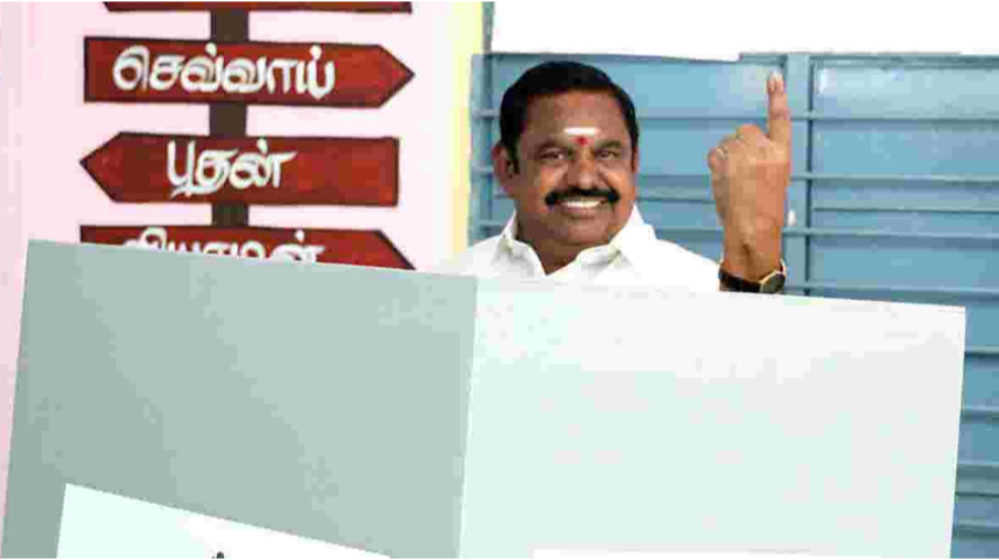
சேலம்: தனது சொந்த சிலுவம்பாளையத்தில் யில் தனது கிராமமான உள்ள வாக்குச்சாவுடியில் குடும்பத்துடன் சென்று

அதிமுக பொதுச்செயலாளர் எடப்பாடி பழனிசாமி வாக்களித்தார். தமிழ்நாடு சட்டமன்றத் தேர்தலுக்கான வாக்குப்பதிவு, ஒரே கட்டமாக 234 சட்டமன்றத் தொகுதிகளிலும் (ஏப்ரல் 23) காலை 07.00 மணிக்கு தொடங்கிவிறுவிறுப்பாக நடைபெற்று வருகிறது. மாலை 06.00 மணி வரை வாக்குப்பதிவு நடைபெற உள்ள நிலையில் காலை முதலே பொதுமக்கள் நீண்ட வரிசையில் காத்திருந்து வாக்களித்து வருகின்றனர். இத்தேர்தலில் திமுக, அதிமுக, நாம் தமிழர் கட்சி, தமிழக வெற்றிக் கழகம் என நான்கு முனைப்போட்டி நிலவுகிறது. தமிழ்நாடு சட்டமன்றத் தேர்தலில் 5.73 கோடி பேர் வாக்களிக்க உள்ளனர். 442 பெண்கள் உள்ள 4,023 வேட்பாளர்கள் களத்தில் உள்ளனர். தேர்தல் பாதுகாப்புப் பணியில் 295 துணை ராணுவப் படைகம்பெனிகளைச் சேர்ந்த வீரர்கள் ஈடுபட்டுள்ளனர். அதேபோல், 1 லட்சத்திற்கும் மேற்பட்ட தமிழ்நாடு போலீசாரும் பாதுகாப்புப்பணியில் ஈடுபட்டுள்ளனர். வாக்காளர்களுக்கு தேவையான