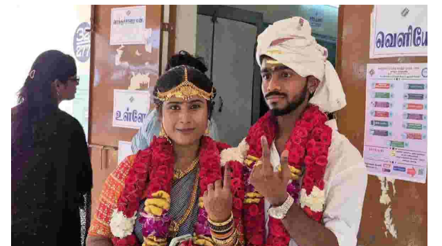
தியினரின் செயல், அங்கிருந்த வாக்காளர்கள் மற்றும் தேர்தல் அலுவலர்களிடையே பெரும் நெகிழ்ச்சியை ஏற்படுத்தியது.

வந்து வாக்களித்தோம். வாக்களிப்பது நமது உரிமைமட்டுமல்ல. அது ஒவ்வொரு குடிமக்களின் கடமையும் கூட" என்று தெரிவித்தனர். வாக்களிக்கும் நேரம் முடியும் நிலையில், திருமண மேடையிலிருந்து நேரடியாக வந்து வாக்களித்த இந்த இளம் தம்ப-