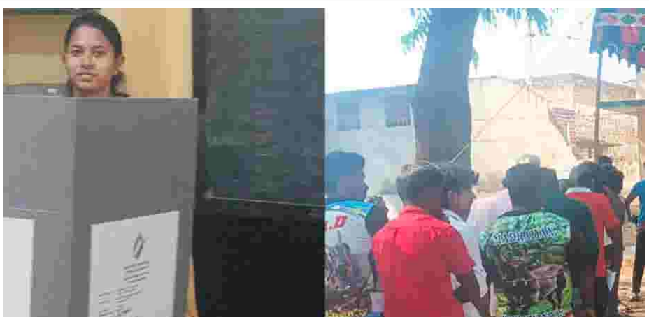
சேலம் மாவட்டம் ஓமலூர் அருகே தொளசம்பட்டியில் உள்ள பேரறிஞர் அண்ணா அரசு மேல்நிலைப்பள்ளி மற்றும் ஊராட்சி ஒன்றிய தொடக்கப்பள்ளி வாக்குச்சாவடி மையங்களில் வாக்காளர்கள் காலை 7 மணி முதல் 7 மணி வரையில் நீண்ட வரிசையில் நின்று வாக்கு செலுத்தி ஜனநாயக கடமையை நிறைவேற்றினர். தொளசம்பட்டியில் அமைதியான முறையில் விடுவிப்பாக வாக்கு பதிவு நடைபெற்றது.