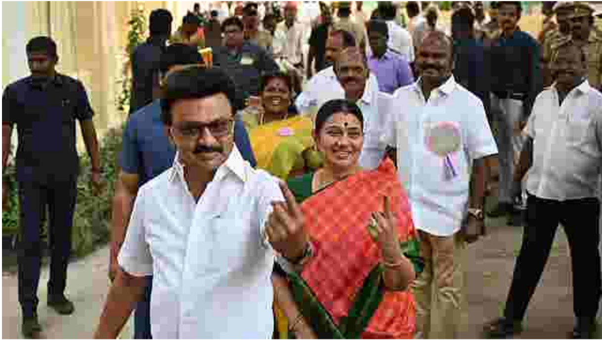
சென்னை: திமுக மு.க.ஸ்டாலின் தனது கடமையை நிறைவேற்றி வந்தார். தமிழ்நாட்டில் முதலமைச்சருமான வாக்களித்து ஜனநாயகக் கடமையை நிறைவேற்றி வந்தார். தமிழ்நாட்டில் முதலமைச்சருமான வாக்களித்து ஜனநாயகக் கடமையை நிறைவேற்றி வந்தார். தமிழ்நாட்டில் முதலமைச்சருமான வாக்களித்து ஜனநாயகக் கடமையை நிறைவேற்றி வந்தார்.

விஜய் (ஏப்ரல் 23) காலை 07.00 மணிக்கு தொடங்கி விறுவிறுப்பாக நடைபெற்று வருகிறது. காலை முதலே பொதுமக்கள் நீண்ட வரிசையில் காத்திருந்து வாக்களித்து வருகின்றனர். அதேபோல் அரசியல் கட்சிகளின் தலைவர்கள், வேட்பாளர்கள், திரைப் பிரபலங்கள், தொழிலதிபர்கள் உள்ளிட்டோர் ஆர்வத்துடன் வாக்களித்து வருகின்றனர். மாலை 06.00 மணியுடன் வாக்குப்பதிவு நிறைவேட்டைகிறது. தற்போது கோடைக்காலம் என்பதால் வாக்குச்சாவுடிமையங்களில் நிழற்பந்தல் அமைக்கப்பட்டுள்ளது. அந்தவகையில், சென்னை தேர்தலில் வேட்டையில் உள்ள கல்லூரியில் அமைக்கப்பட்டிருந்த வாக்குச்சாவுடிமையத்திற்கு தனது மனைவி