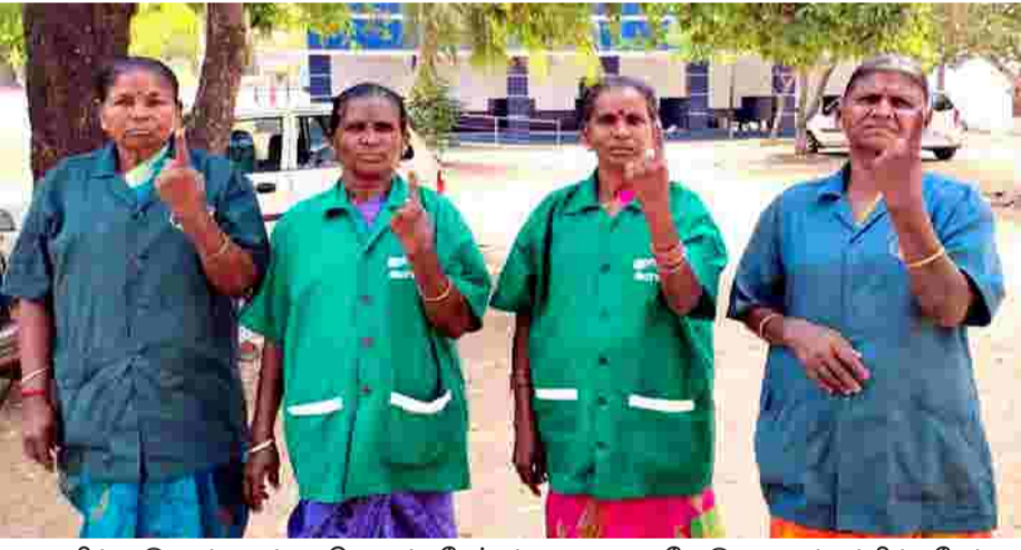
தமிழ்நாடு சட்டமன்ற பொதுத் தேர்தல் 2026 ஈரோடு மாவட்டத்தில் நேற்று 23.04.2026 தூய்மைப்பணியாளர்கள் தங்களது வாக்கினை செலுத்தி ஜனநாயகக் கடமையினை ஆற்றினார்கள்.