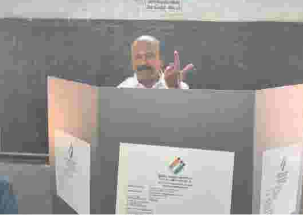
தனியார் பள்ளியில் தனது வாக்கினை செலுத்தி தனது வாக்கினை செலுத்தி செய்தியாளர்களை சந்தித்து அவர் கூறிய தாவது: திருப்பரங்குன்றம் வெற்றி தொகுதியாக அதிமுக கூட்டணி வெற்றிக்கு முன்னுதாரணமாக இருக்கும். மிகப்பெரிய வித்தியாசத்தில் அதிமுக வெற்றி பெறும். திருப்பரங்குன்றத்தில் மிகப்பெரிய வாக்கு வித்தியாசத்தில் வெற்றி பெறுவேன் என்கிற நம்பிக்கை உள்ளது யாரை கேட்டாலும் அதிமுக என்று சொல்கிறார்கள். அதிமுக ஆட்சிக்கு வருவது உறுதி என கூறினார்.