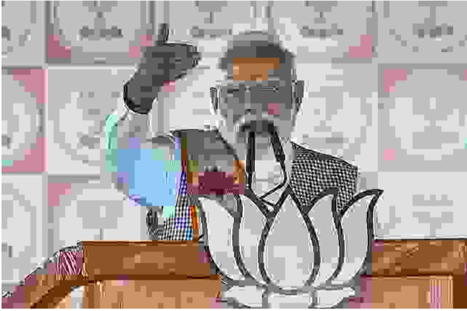
பாரக்பூர்: மே 4-ஆம் தேதி தேர்தல் முடிவுகள் வெளியாகும் போது பாஜக வெற்றி பெறும் என்பதில் முழு நம்பிக்கை உள்ளது. அடுத்ததாக பாஜக அரசின் பதவியேற்பு விழாவுக்காக நான் மீண்டும் மேற்கு வங்கம் வருவேன் என்று பிரதமர் மோடி நம்பிக்கை தெரிவித்தார். இரண்டாம் கட்ட

வாக்குப் பதிவுக்காக மேற்கு வங்க மாநிலம் பாரக்பூரில் நடந்த பிரச்சாரப் பொதுக் கூட்டத்தில் பேசிய பிரதமர் மோடி, "மேற்கு வங்கத்தின் மீது நான் கொண்டுள்ள பற்று என்பது சக்தி மீதான ஒரு பக்தியாகவே இருந்து வருகிறது. எனது தனிப்பட்ட ஆன்மிகப் பயணத்தின் ஆற்றல் மையமாக இப்பகுதி திகழ்கிறது. மேற்கு வங்கத்தின் மகத்தான ஆளுமைகளாலும், இங்கு மக்கள் வாடவில்லை. உள் கடைவுகளின் அளவற்ற அன்பாலும் நான் பெரிதும் ஈர்க்கப்பட்டுள்ளேன். இந்தப் பூர்ணியூயி-யில் நான் பெற்ற அனுபவங்களை, எனக்குக் கிடைத்த ஒரு பெரும் வரமாகவே நான் கருதுகிறேன். இந்தத் தேர்தலில் நான் பங்கேற்கும் கடைசிப் பேரணி இதுதான். மேற்கு வங்கத்தில் நான் சென்ற இடமெல்லாம் மக்களின் மனநிலையை மிக உன்னிப்பாகக் கவனித்தேன். மே 4-ஆம் தேதி தேர்தல் முடிவுகள் வெளியான பிறகு, பாஜகவின் பதவியேற்பு விழாவில் கலந்துகொள்வதற்காக நான் மீண்டும் இங்கு வர நேரிடும் என்ற முழு நம்பிக்கையுடன் நான் திரும்புகிறேன். மேற்கு வங்கத்தில் நடைபெற்ற பேரணிகள் மற்றும் சாலையப் பயணங்களின்போது, என் மனம் நெகிழக் கூடிய வகையிலான செய்திகளையும், ஓவியங்களையும் நான் பரிசாகப் பெற்றேன். அவற்றை என்னால் ஒருபோதும் மறக்க இயலாது. பிரச்சார நிகழ்வுகள் முடிந்த பிறகு, இரவில் தனித்து அமர்ந்து, ஒவ்வொரு ஒவியத்தையும் மிகக் கவனமாகப் பார்வையிடுவேன். அந்த ஒவியங்களை வரைந்த கலைஞர்கள் வெளிப்படுத்திய உணர்வுகளை ஆழ்ந்து