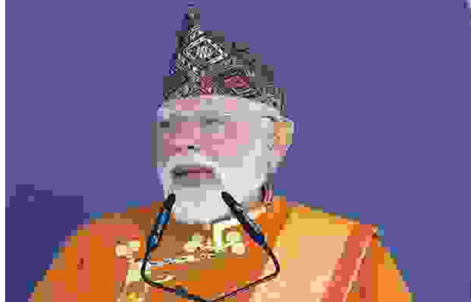
காங்கடாக்: மொழி அடிப்படையில் நாட்டிற்கும் பிராந்திய டைப் பிளவுபடுத்த முயற்சிகள் மேற்கொள்ளப்பட்டு வரும்