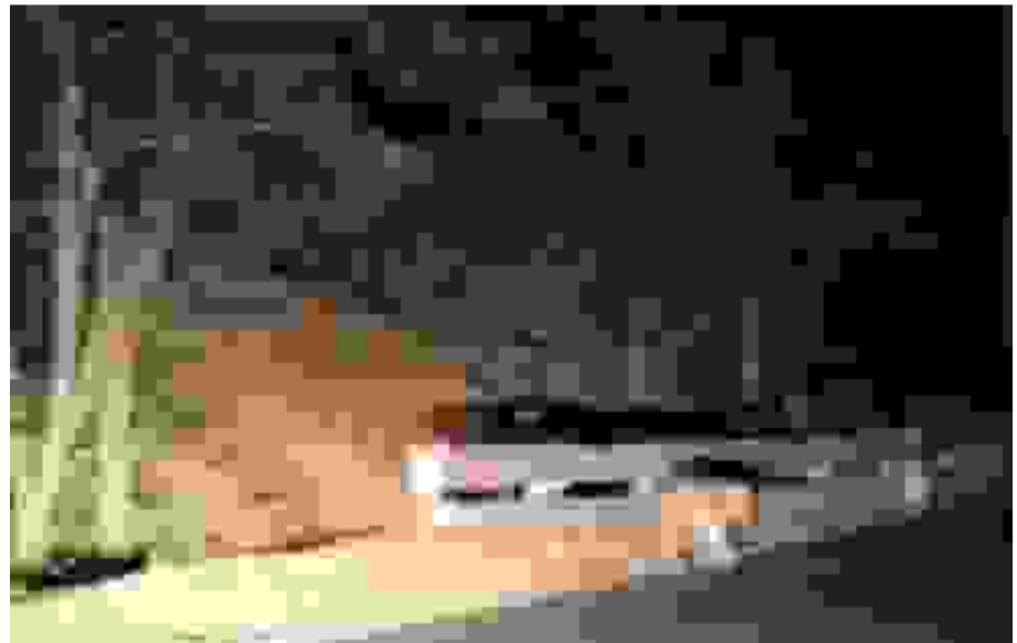
ஈரோடு மாவட்டம் தாளவாடி மலைப்பகுதியில் உள்ள 27 கொண்டை ஊசி வளைவுகளில், 17வது வளைவு அருகே நேற்று முன்தினம் இரவு சிறுத்தை ஒன்று சாலையில் நடந்து சென்றது. இதனைக் கண்ட வாகன ஓட்டிகள் தங்கள் வாகனங்களை நிறுத்தி, அதனைப் பலரும் செல்போனில் படம் பிடித்தனர். வளத்துறையினர், இரவு நேரங்களில் வாகன ஓட்டிகள் மிகுந்த கவனத்துடன் செல்ல வேண்டும் என்றும், இரு சக்கர வாகனங்களில் செல்வோர் இரவு பயணத்தைத் தவிர்க்க வேண்டும் என்றும் எச்சரித்துள்ளனர்.