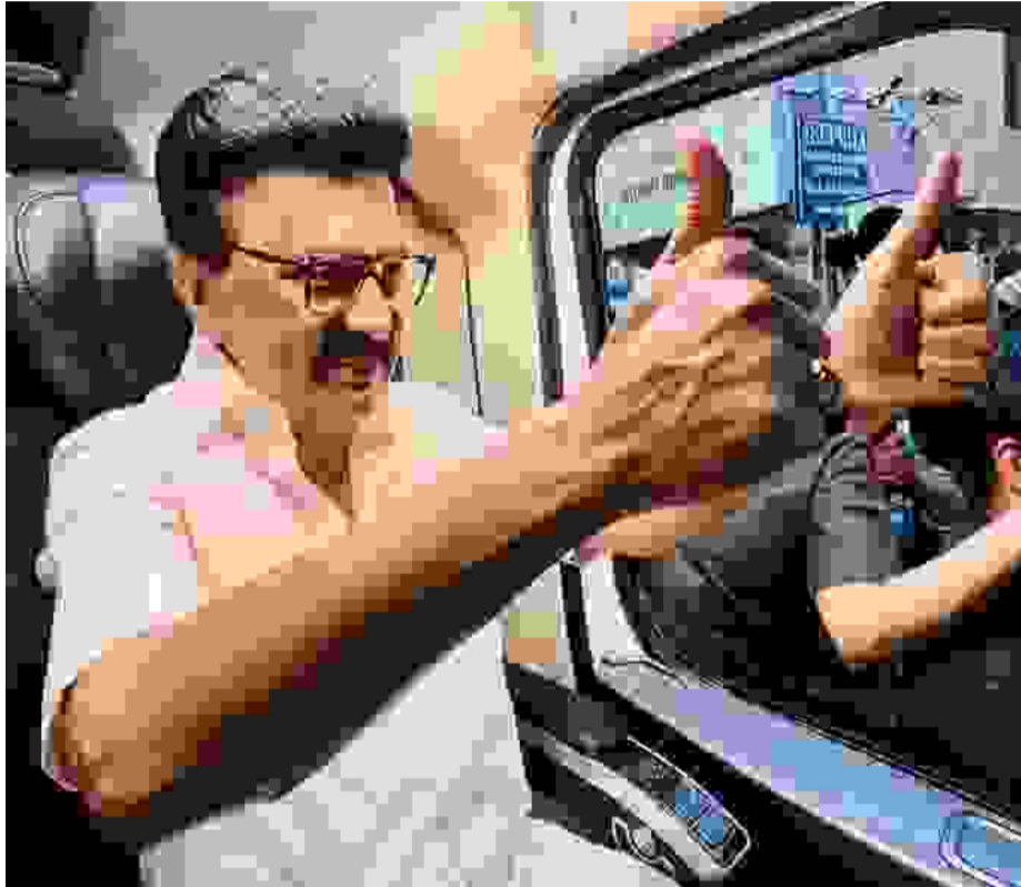
தமிழ்நாடு முதல் பக்கத்தில், "தமிழ்நாடு விட மாடல் தனித்துவம்மைச்சர் மு.க.ஸ்டாலின், என்றாலே சாதனை, தனது எக்ஸ் வலைதள சாதனை,சாதனை.திரா-மான மாடல். சொன்னதை, எண்களிலும்