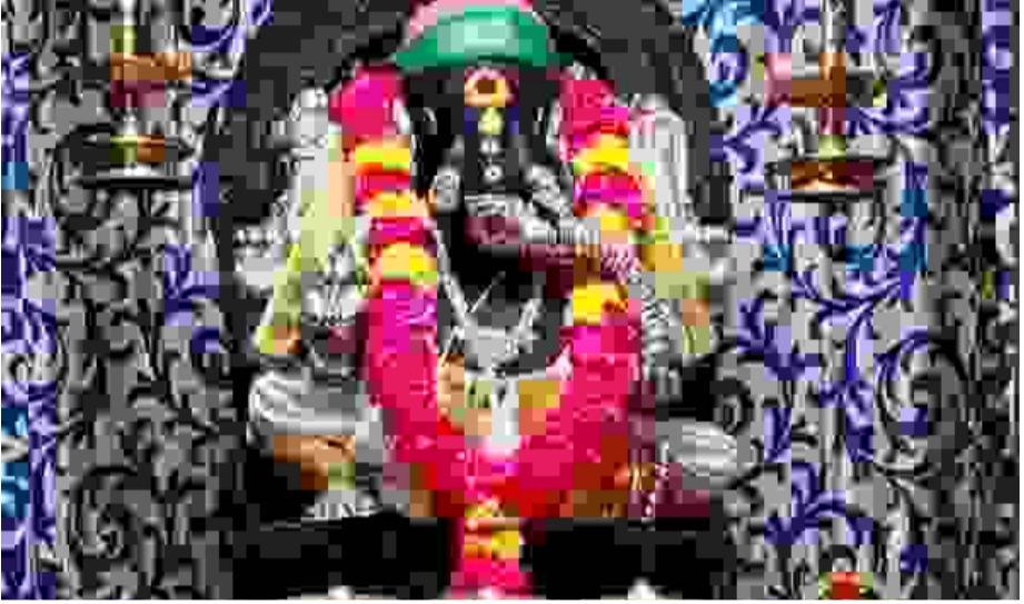
ஈரோடு மாவட்டம் சத்தியமங்கலம் காவல் நிலையம் பின்புறம் உள்ள வரலாற்று சான்றாக கோயிலில், நேற்று சிறப்பு பூஜை மற்றும் வழிபாடுகள் நடைபெற்றன. விநாயக பெருமானுக்கு பால், பன்னீர், கேள், இளநீர் மற்றும் கரும்புச்சாறு உள்ளிட்ட அட்ட திரவியங்களால் அபிஷேகம் செய்யப்பட்டு, வண்ண மலர்களால் சிறப்பு அலங்காரம் செய்யப்பட்டது. தொடர்ந்து சகலநாம அர்ச்சனை மற்றும் மஹா தீபாராதனை நடைபெற்றது. இந்த நிகழ்வில் திரளான பக்தர்கள் பங்கேற்று தரிசனம் செய்தனர்.