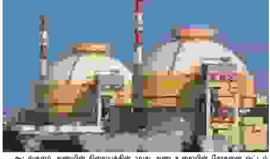
கூடங்குளம் அணுவின் நிலையத்தின் 3வது அணு உலையின் சோதனை ஓட்டம் 27 ஏப்ரல் 2026 அன்று அதிகாரப்பூர்வமாகத் தொடங்கியது. அணு உலைக்குள் நீர் பாய்ச்சும் பணி (Hot Run) வெற்றிகரமாக ஆரம்பிக்கப்பட்டு, முக்கிய பாகங்களின் செயல்பாடு மற்றும் பாதுகாப்பு அம்சங்கள் சோதிக்கப்பட்டு வருகின்றன. இது 1000 மெகாவாட் திறன் கொண்ட தற்சார்பு அணு உலை பிரிவாகும்.