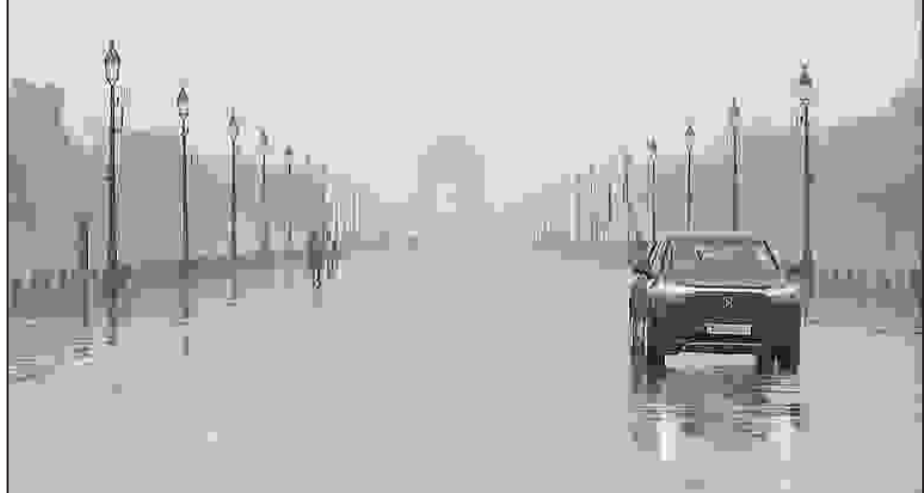
புதுடெல்லி: தலைநகர் டெல்லி மற்றும் அதன் சுற்று வட்டார பகுதிகளில் இன்று காலை மழை பொழிவு பதிவானது. இதன் மூலம் கடந்த சில

நாட்களாக அங்குள்ள மக்களை வாட்டி வந்த கோடை வெப்பம் சற்று தணிந்துள்ளது. மழையுடன் கூடுதல் 40 கிலோமீட்டர் வேகத்தில் வீசியதால் வெப்பநிலை அங்கு சரிந்துள்ளது. டெல்லியின் பல்வேறு பகுதிகளில் மழைப் பொழிவு லேசானதாக ஆரம்பமானது. அதைத் தொடர்ந்து திளேரென் வானிலை நிலவரம் மாறியது. வானில் கருமேகங்கள் குழமழை பொழிவு தொடர்ந்தது. முன்னதாக, செவ்வாய்க்கிழமை அன்று 39.2 டிகிரி செல்சியஸ் வெப்பம் டெல்லியில்