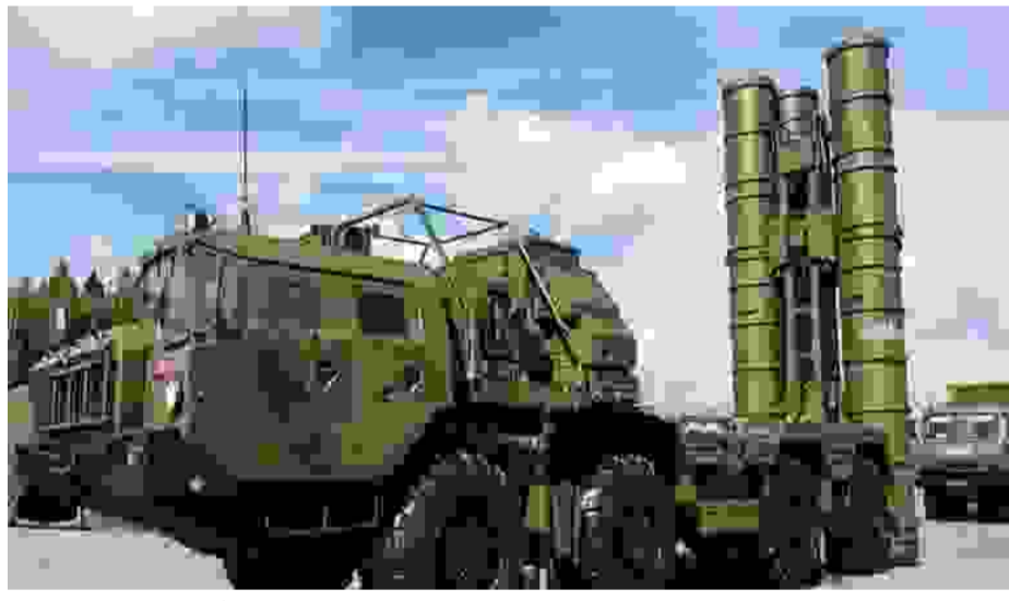
புதுடெல்லி: இந்தியாவுக்கான 4-வது எஸ்-400 வான் பாதுகாப்பு கவச வாகனத்தை ரஷ்யா

அனுப்பி வைத்துள்ளது. ரஷ்யாவிடம் இருந்து அதிநவீன எஸ்-400 வான் பாதுகாப்பு கவச வாகனம் வாங்க கடந்த 2018-ல் மத்திய அரசு ஒப்பந்தம் செய்தது. இதன்படி 5 எஸ்-400 பாதுகாப்பு கவச