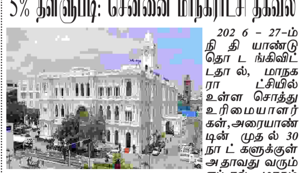
2026 - 27-ம் நிதியாண்டு தொடங்கிவிட்டதால், மாநகராட்சியில் உள்ள சொத்து உரிமையாளர்கள், அரையாண்டின் முதல் 30 நாட்களுக்குள் அதாவது வரும் ஏப்ரல் மாதம் 30-ம் தேதிக்குள் முதல் அரையாண்டுகளை முடித்து வரியைச் செலுத்தினால், மாநகராட்சி சார்பில் சொத்துவரியில் 5 சதவீதம் வரை தள்ளுபடி வழங்கப்படும் என அறிவிக்கப்பட்டுள்ளது. வரிசெலுத்துவதோடு மட்டுமல்லாமல், அரசுதரும் இந்தத் தள்ளுபடியை சரியாகப் பயன்படுத்தினால் அதி கப்பட்ட ரூ.5 ஆயிரம் வரை மிச்சப்படுத்தலாம். மேலும் ஒரு சதவீத அபராதத் தொகையையும் தவிர்த்தலாம். பொது மக்கள் தங்கள் வரிகளை எளிமையான முறையில் செலுத்த நேரடியாக கணினி வரி வசூல் மையங்கள், http://turbanepay.in.gov.in என்ற இணையதளம், டிஎன்ஏ பன் இ-சேவை செயலி மற்றும் யுபிஐ செயலிகள் என பல்வேறு வசதிகள் இருக்கின்றன. ஏப்.30-க்கு இன்னும் 2 நாட்கள் மட்டுமே இருப்பதால் பொதுமக்கள் இந்த சலுகையை பயன்படுத்திக்கொள்ளுமாறு மாநகராட்சி அறிவுறுத்தியுள்ளது.