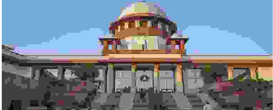
புதுடெல்லி: நாட்டில் தொடர்ந்து நடைபெறும் டிஜிட்டல்

கைது முறைகேடுகள் குறித்து உச்ச நீதிமன்றம் தாமத முன்வந்து வழக்குப் பதிவு செய்தது. இந்த வழக்கை தலைமை நீதிபதி குர்யானை அமர்வு விசாரித்து வருகிறது. இந்த வழக்கில் மத்திய உள் துறை அமைச்சகம் சார்பில் தலைமை வழக்கறிஞர் ஆர். வெங்கட ரமணி, உச்ச நீதிமன்றத்தில் தற்போதைய நிலை அறிக்கையை தாக்கல் செய்துள்ளார். அதில் கூறியிருப்பதாவது: டிஜிட்டல் கைது முறைகேடுகளை தடுக்க தேவை