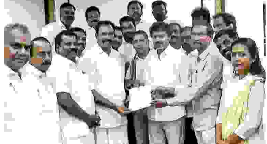
சென்னை: தவெக ஆட்சி அமைக்க ஆதரவு அளிப்பதாக காங்கிரஸ் கட்சி அறிவித்துள்ளது. அக்கட்சி வெளியிட்டுள்ள அறிக்கையில், மதவாத சக்திகளுக்கு ஆதரவாக செயல்படக்கூடாது என்ற நிபந்தனையுடன் ஆதரவு

அளிப்பதாகத் தெரிவிக்கப்பட்டுள்ளது. இன்னால்தமிழகத்தில்தமிழக உடனான காங்கிரஸ் கூட்டணி முடிவுக்குவந்துள்ளது. நடந்து முடிந்த சட்டப்பேரவைத் தேர்தலில் தனிப்பெரும் கட்சியாக தவெக உருவெடுத்துள்ள