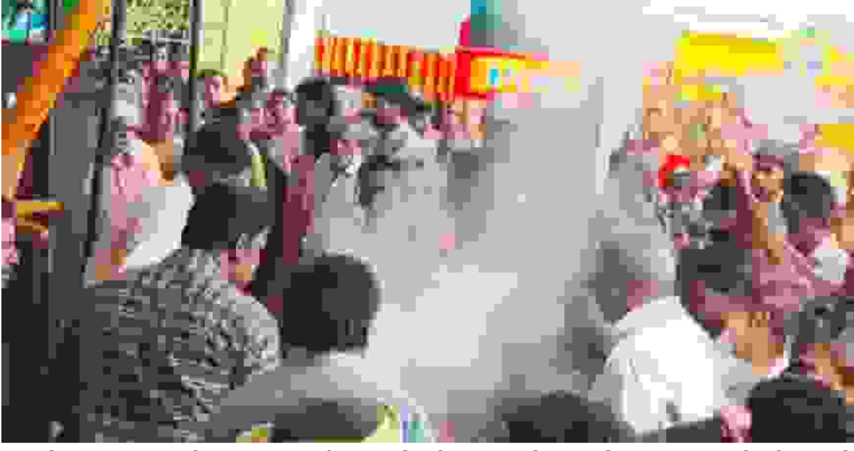
ஈரோடு மாவட்டம் விஜயமங்கலம் மாரியம்மன் கோவிலில் நடைபெற்ற பூவோடு எடுத்தல் திருவிழா பக்தி பரவசத்துடன் நடைபெற்றது. பக்தர்கள் மேள தாள ஒலியுடன் கலந்து கொண்டு நேர்த்திக்கடன் செலுத்தினர். குழந்தைகள் முதல் முதியவர்கள் வரை திரளாக கலந்து கொண்டு உற்சாகமாக வழிபட்டனர். இவ்விழாவையொட்டி சிறப்பு பூஜைகள் நடைபெற்றதுடன், கோவில் வளாகம் முழுவதும் திருவிழா கோலாகலமாக காணப்பட்டது.