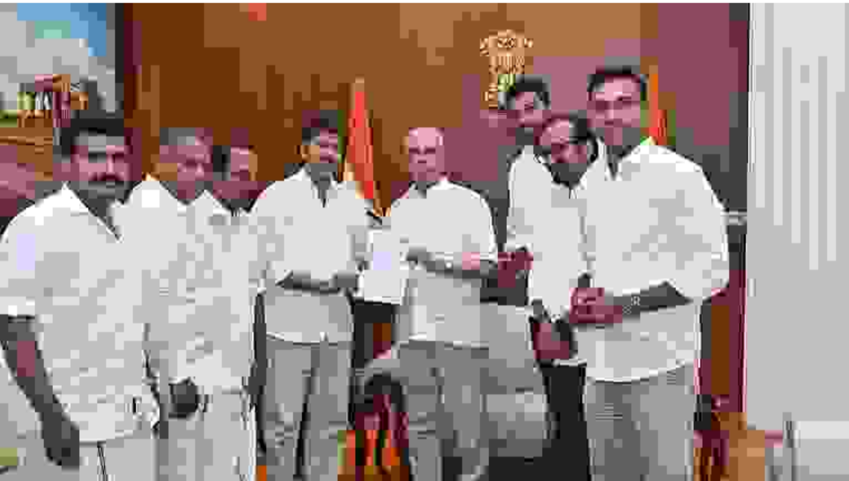
சென்னை: தமிழக ஆளுநர் ராஜேந்திர அர்-லேகரை ஆளுநர் மாளிகையில் சந்தித்து, தவெக தலைவர் விஜய் ஆட்சி

அமைக்க உரிமை கோரினார். தனிப்பெரும் கட்சி என்ற அடிப்படையில் தவெக தலைவர் விஜய், ஆளுநர் ராஜேந்திர அர்-