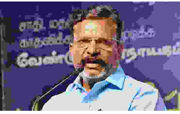
சென்னை: மீண்டும் மீண்டும் விஜய்யை, கைப்பாவையாக வைத்துக் கொள்ள பாஜக முயற்சிக்கிறது. ஆளுநரும் அதற்கு ஏற்புடைய செயல்படுத்து போல தெரிகிறது. விஜய்யை பதவியேற்க அனுமதிப்பது தான் அரசியல் சட்டப்பூர்வமான கடமை என விசிகதலைவர்திருமாவளவன் தெரிவித்துள்ளார்.

பன்னுகிறோம். இதில் உள்ள நிறை, குறை; நல்லது கெட்டது மற்றும் எதிர்கால அரசியல் போக்குகளை நாங்கள் பரிசீலிப்போம் என சொல்லி இருக்கிறோம். இது குறித்து முடிவை நான் முன் கூட்டியே அறிவிக்க முடியாது. அவர்களாகவே பாதுகாப்பு கொடுத்தார்கள்; பிறகு அவர்களாகவே பாதுகாப்பை திரும்பப் பெற்றுக் கொண்டனர். இப்போது என்ன நெருக்கடியை தர முயற்சிக்கிறார்கள். மீண்டும் மீண்டும் விஜய்யை, கைப்பாவையாக வைத்துக் கொள்ள பாஜக முயற்சிக்கிறது. ஆளுநரும் அதற்கு ஏற்புடைய செயல்படுத்து போல தெரிகிறது. விஜய்யை பதவியேற்க அனுமதிப்பது தான் அரசியல் சட்டப்பூர்வமான கடமை. விஜய் கடிதம் எழுதியிருக்கிறார்; பேசினார். நாங்கள் இது குறித்து ஆலோசித்து முடிவு செய்வோம் என அறிவித்தோம். இவ்வாறு அவர் பேசினார்.