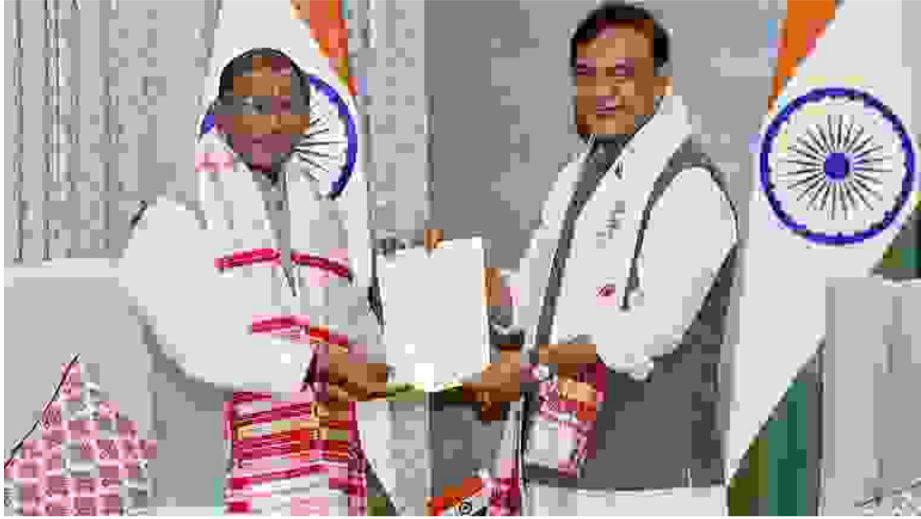
சென்னை: மீண்டும் மீண்டும் விஜய்யை, கைப்பாவையாக வைத்துக் கொள்ள பாஜக முயற்சிக்கிறது. ஆளுநரும் அதற்கு ஏற்புடைய செயல்படுத்து போல தெரிகிறது. விஜய்யை பதவியேற்க அனுமதிப்பது தான் அரசியல் சட்டப்பூர்வமான கடமை என விசிகதலைவர்திருமாவளவன் தெரிவித்துள்ளார்.

இது குறித்து அவர் செய்தியாளர்களிடம் பேசும்போது, "பாஜக, அதாவது மோடி, அமித் ஷா தமிழக அரசியலுக்குள் தலையீடு செய்து குழப்பத்தை ஏற்படுத்த முயல்கிறார்கள். தனிப் பெரும் கட்சியாக தவிர விஜய்யை பதவி ஏற்க ஆளுநர் அனுமதிக்க வேண்டும் என்பதுதான் அரசியலமைப்பு சட்டம் காட்டுகின்ற வழிகாட்டுதல். விஜய் ஆட்சி அமைக்க ஆதரவு கோரிய நிலையில், ஆளுநர் இன்னும் இது குறித்து எந்த முடிவையும் எடுக்காமல்