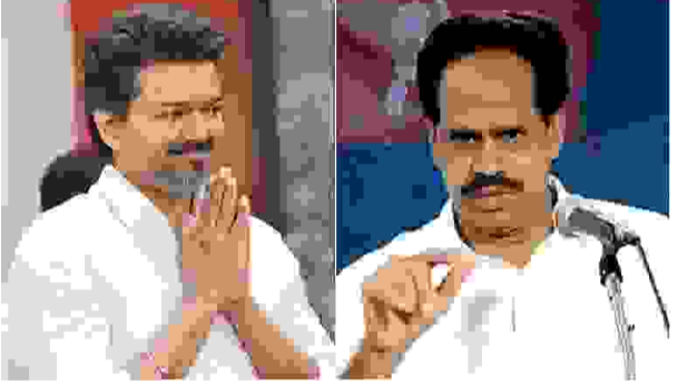
சென்னை: அரசியலமைப்பு சட்டத்தை மீறுவது ஆளுநர் செயல்பட வேண்டும் என்றும், பதவி ஏற்புக்கு முன்பு தவிர, தனது பெரும்பான்மையை நிரூபிக்க வேண்டும் என ஆளுநர் நிர்ப்பந்திப்பது ஏற்புடையதல்ல என்றும் இந்திய கம்யூனிஸ்ட் கட்சி வலியுறுத்தியுள்ளது.