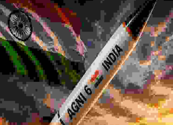
புதுடெல்லி: பத்தாயிரம் கி.மீ. வரை கண்டம் விட்டு கண்டம் பாயும் அக்னி-6 ஏவுகணை வரலாறு படைக்க தயாராக உள்ளது என்று பாஜக தெரிவித்துள்ளது. இந்தியாவின் முதல் கண்டம் விட்டு கண்டம் பாயும் அக்னி-6 ஏவுகணையை பாதுகாப்பு ஆராய்ச்சி மற்றும் மேம்பாட்டு அமைப்பு (டிஆர்டிஓ) வடிவமைத்து உள்ளது.