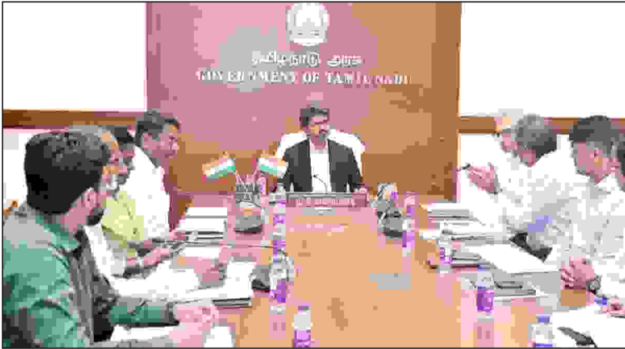
தமிழ்நாட்டில் முதலீடு செய்வதற்கான சாத்திய கூறுகள் என்ன? தற்போதுமுதலமைச்சர் சி. ஜோசப் விஜய் ஆலோசனை நடத்தினார். இதில் ஆலோசனைகூட்டத்தில் ஆட்டோமொபைல் நிறுவனங்களின் எதிர்-நிலைப்பாளர்கள் உள்ளே பங்கேற்று கருத்து முத்தல-மைய சார்ந்த, பி.எம்.டபிள்யூ. டி.வி.எஸ். போன்ற மோட்டார் வாகன நிறுவனங்களில் தலைமை செயல் அலுவலர்கள் முதலமைச்சரை சந்தித்தனர். இந்த ஆலோசனை கூட்டத்தில் வாயிலாக, ஆட்டோமொபைல் நிறுவனங்கள் மூலம் புதிய முதலீடுகளை ஈர்க்கும்

வகையில் ஏற்கனவே செய்யப்பட்டுள்ள ஒப்பந்தங்கள் மற்றும் புதிய முதலீடுகள் ஈர்ப்பு தொடர்பாக விஜய் ஆலோசனை நடத்தினார். தமிழ்நாட்டில் முதலீடு செய்வதற்கான சாத்திய கூறுகள் என்ன? தற்போதுமுதலமைச்சர் சி. ஜோசப் விஜய் ஆலோசனை நடத்தினார். இந்த ஆலோசனைகூட்டத்தில் ஆட்டோமொபைல் நிறுவனங்களின் எதிர்-நிலைப்பாளர்கள் உள்ளே பங்கேற்று கருத்து முத்தல-மைய சார்ந்த, பி.எம்.டபிள்யூ. டி.வி.எஸ். போன்ற மோட்டார் வாகன நிறுவனங்களில் தலைமை செயல் அலுவலர்கள் முதலமைச்சரை சந்தித்தனர். இந்த ஆலோசனை கூட்டத்தில் வாயிலாக, ஆட்டோமொபைல் நிறுவனங்கள் மூலம் புதிய முதலீடுகளை ஈர்க்கும்