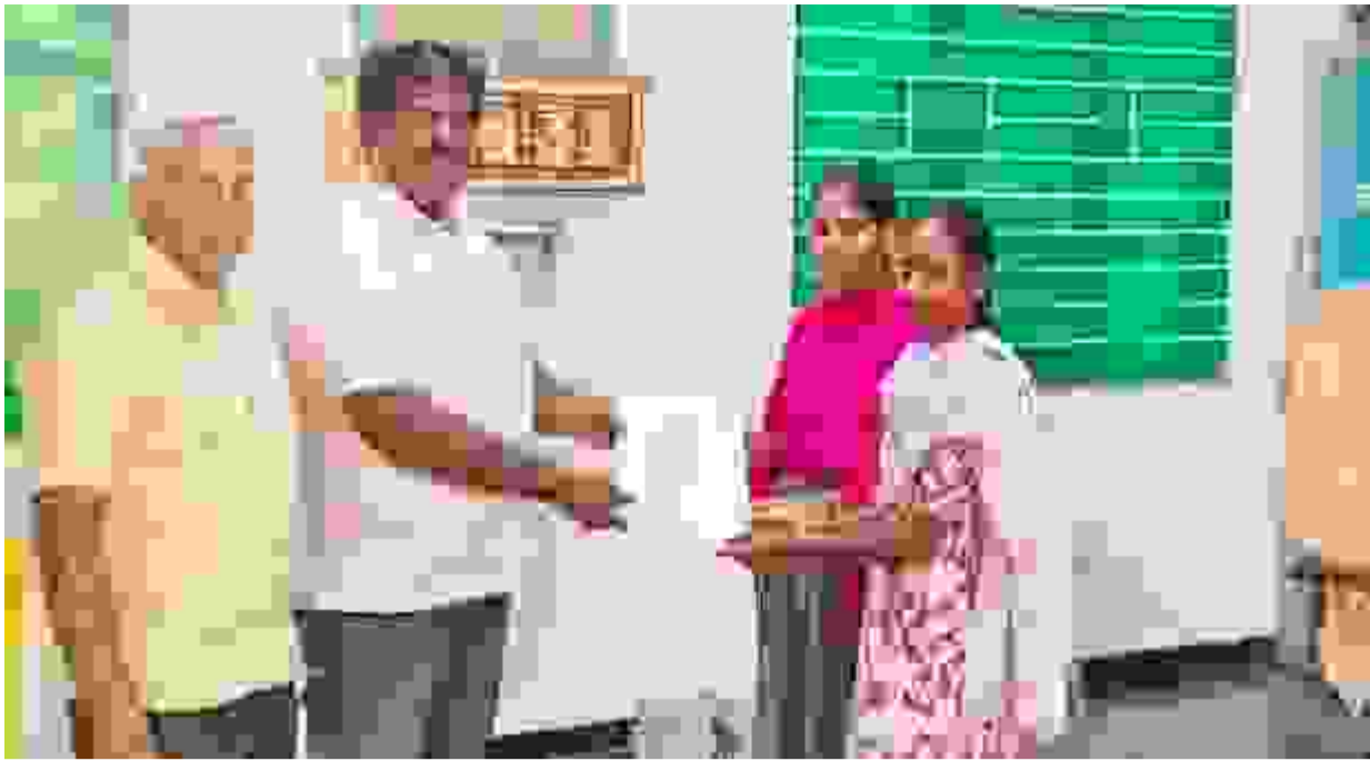
ஈரோடு மாவட்டம் கோபி வட்டம் கூகலூர் கிராமத்தில் அமைந்துள்ள அரசு உதவிபெறும் காந்தி கல்வி நிலையம் மேல்நிலைப்பள்ளி 202526 ஆம் கல்வியாண்டில் பிளஸ் 2 தேர்வில் 100 சதவீத தேர்ச்சி பெற்று சாதனை படைத்துள்ளது. இந்நிலையில், தேர்ச்சி பெற்ற மாணவ மாணவிகள் உயர்கல்வி பயில் வசதியாக, அவர்களுக்கான மதிப்பெண் சான்றிதழ்களை பள்ளித் தலைமை ஆசிரியர் வழங்கி வாழ்த்து தெரிவித்தார்.