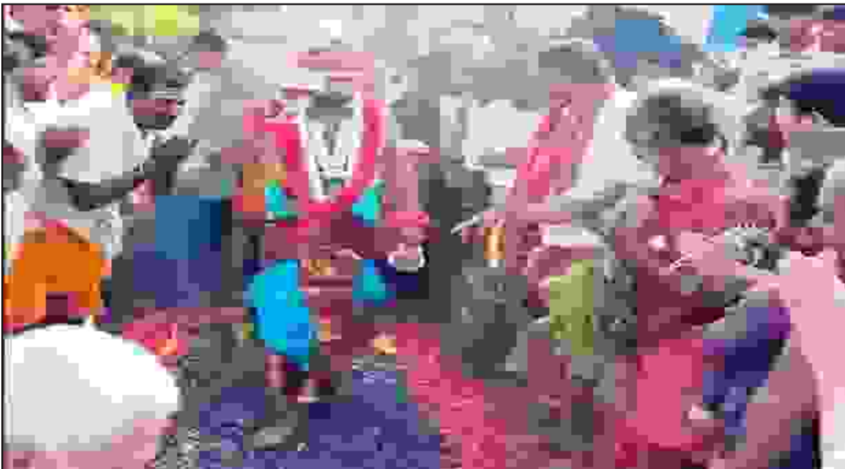
ஈரோடு மாவட்டம் சத்தியமங்கலம் வடக்குபேட்டை பகுதியில் அமைந்துள்ள தண்டுமாரி அம்மன் கோவில் குண்டம் இறங்கும் திருவிழா விமரிசையாகத் தொடங்கியது. இதற்கான பணிகள் நேற்று முன்தினம் இரவு முதல் தொடங்கிய நிலையில், நேற்று காலை கோவிலின் தலைமை பூசாரி முதலில் குண்டம் இறங்கி விழாவைத் தொடங்கி வைத்தார். இதனைத் தொடர்ந்து, ஆயிரக்கணக்கான பக்தர்கள் நீண்ட வரிசையில் நின்று பக்திப் பெருக்குடன் குண்டம் இறங்கி வருகின்றனர்.