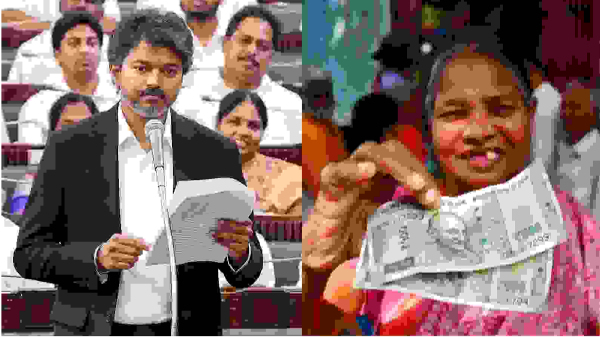
சென்னை: "பெண்க- ரூ.1000/- உரிமைத் பட்டு வரும் கலைஞர் தொகைத் திட்டத்தினை மாதந்தோறும் தொகையாக வழங்கப்- மகளிர் உரிமைத் திட்டத்தினை மறுசீரமைப்பு செய்ய

அரசுக்கு உரிய கால அவகாசம் தேவைப்படுகிறது. ஆனால், மே 2026 மாதத்திற்கான கலைஞர் மகளிர் உரிமைத் தொகைப் பயனாளிகளின் வங்கிக் கணக்கில் விரைவில் வரவு வைக்கப்படும். என தமிழக முதல்வர் விஜய்தேரிவித்துள்ளார். இது தொடர்பாக தமிழக அரசு வெளியிட்டிருக்கின்ற அறிக்கையில், மே 2026 மாதத்திற்கான கலைஞர் மகளிர் உரிமைத் தொகைப் பயனாளிகளின் வங்கிக் கணக்கில் விரைவில் வரவு வைக்கப்படும். பெண்களுக்கு மாதந்தோறும் ரூ.1000/- உரிமைத் தொகையாக வழங்கப்பட்டு வரும் கலைஞர் மகளிர் உரிமைத் தொகைத் திட்டத்தினை மறுசீரமைப்பு செய்யும் முயற்சி அரசு மேற்கொண்டுள்ளது. மேலும், மீண்டும் திமுக ஆட்சிக்கு வந்தால் மகளிர் உரிமைத் தொகை ரூ.2 ஆயிரமாக உயர்த்தி வழங்கப்படும் என அப்போதைய முதல்வர் ஸ்டாலின் வாக்குறுதி அளித்தார். அதேபோல், அதிமுகவும் தனது தேர்தல் அறிக்கையில் தற்போது மகளிர் வங்கிக்கு வழங்கப்பட்டு வரும் கலைஞர் மகளிர் உரிமைத் தொகைத் திட்டத்தினை மறுசீரமைப்பு செய்ய அரசுக்கு உரிய கால அவகாசம் தேவைப்படுகிறது என்று கைவிடுத்துள்ளது.