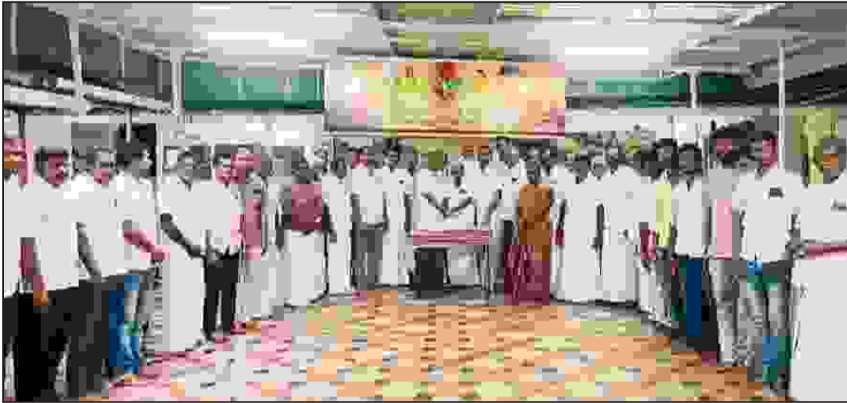
ஈரோடு மாவட்டம் மொடக்குறிச்சி பகுதியில் அதிமுக பொதுச் செயலாளர் எடப்பாடி பழனிசாமி எம்எல்ஏ வின் 72வது பிறந்த நாள் விழா முன்னாள் சட்டமன்ற உறுப்பினர் மற்றும் எம்.ஜி.ஆர் மன்றச் செயலாளர் வி.பி.பழனிசாமி தலைமையில் கேக் வெட்டிக் கொண்டாடப்பட்டது. இந்த நிகழ்வில் அதிமுக முன்னோடிகள் மற்றும் தொண்டர்கள் திரளாக கலந்து கொண்டனர்.