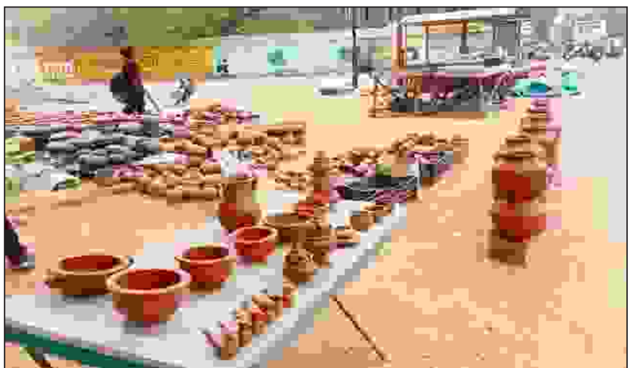
ஈரோடு மாவட்டத்தில் கடந்த சில வாரங்களாக கொளுத்தும் வெயில் காரணமாக, வெப்பநிலை குறையாமல் தொடர்ந்து 100 டிகிரி பாரன்ஹீட்டில் நிலை கொண்டுள்ளது. இந்நிலையில் கோடையில் நிலவும் வெப்பத்தை சமாளிக்க பொதுமக்கள் குளிப்பாணங்கள், இளநீர், தர்பூசணியை சாப்பிட்டு வருகின்றனர். இதன்படி கோடையில், பொதுமக்களின் குளிர்ச்சியான தண்ணீர் பயன்பாட்டிற்காக ஈரோடு மாநகர் கொல்லம்பாளையம் பகுதியில் மண்பாணை விற்பனை அதிகரித்துள்ளதை காணமுடிகிறது.