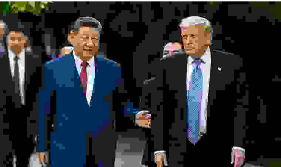
பெய்ஜிங்: அமெரிக்க அதிபர் டிரம்ப் சீன பயணத்தை நிறைவு செய்து பெய்ஜிங்கில் இருந்து நேற்று வரவிருந்த சென் ஹார். சீன அதிபர் ஜி ஜின் பிங் உடன் அமெரிக்க அதிபர் டிரம்ப் இருதரப்பு வர்த்தகம், வரி விதிப்பு, கைவாள், ஈரான் விவகாரங்கள் குறித்து ஆலோசனை நடத்தினார்.

ஈரான் போருக்கு நிறுத்த முற்றுப்புள்ளி வைக்க வேண்டும் என்பது அதிபர் டிரம்ப்பின் பிரதான நோக்கங்களாக உள்ளன. இது தொடர்பாக சீன அதிபர் ஜி ஜின் பிங் கிடம் அவர் விரிவான பேச்சுவார்த்தை நடத்தினார். ஈரானின் 90 சதவீத கச்சா எண்ணெயை சீனா வாங்குகிறது. ஈரானுக்கு தேவையான ஆயுதங்கள், உணவு தானியங்களை சீனாவே விறியோகித்து வருகிறது. எனவே சீனாவின் நிர்வாகம் மூலம் ஈரான் போருக்கு தீர்வு காண முடியும் என்று டிரம்ப் திட்டமிட்டு இருந்தார். இது தொடர்பாக சர்வதேச அரசியல் நோக்கர்கள் கூறியதாவது: சீனா வக்கும் ஈரானுக்கும் மிக நெருங்கிய நட்புறவு நீடிக்கிறது. மூன்றாம் தரப்பு நாடுகளில் இருந்து ஈரானுக்கு தேவையான ஆயுதங்களை சீனா தொடர்ந்து விறியோகம் செய்து வருகிறது. மேலும் ஹார்முஸ் ஜல சந்தி தொடர்ந்து ஈரானின் கட்டுப்பாட்டில் மட்டுமே இருக்க வேண்டும் என்று சீனா விரும்புகிறது. இந்த காரணங்களால் சீன அதிபர் ஜி ஜின் பிங் சாதகமான பதில் அளிக்கவில்லை. ஈரானில் போர் நிறுத்தத்தை அமல்படுத்த சமரச முயற்சிகளில் ஈடுபட மட்டுமே சீன அதிபர் உறுதி அளித்திருக்கிறார். சீன, அமெரிக்க அதிபர்கள் நடத்திய பேச்சுவார்த்தை தோல்வியில் முடிந்திருக்கிறது. இவ்வாறு சர்வதேச அரசியல் நோக்கர்கள் தெரிவித்துள்ளனர்.