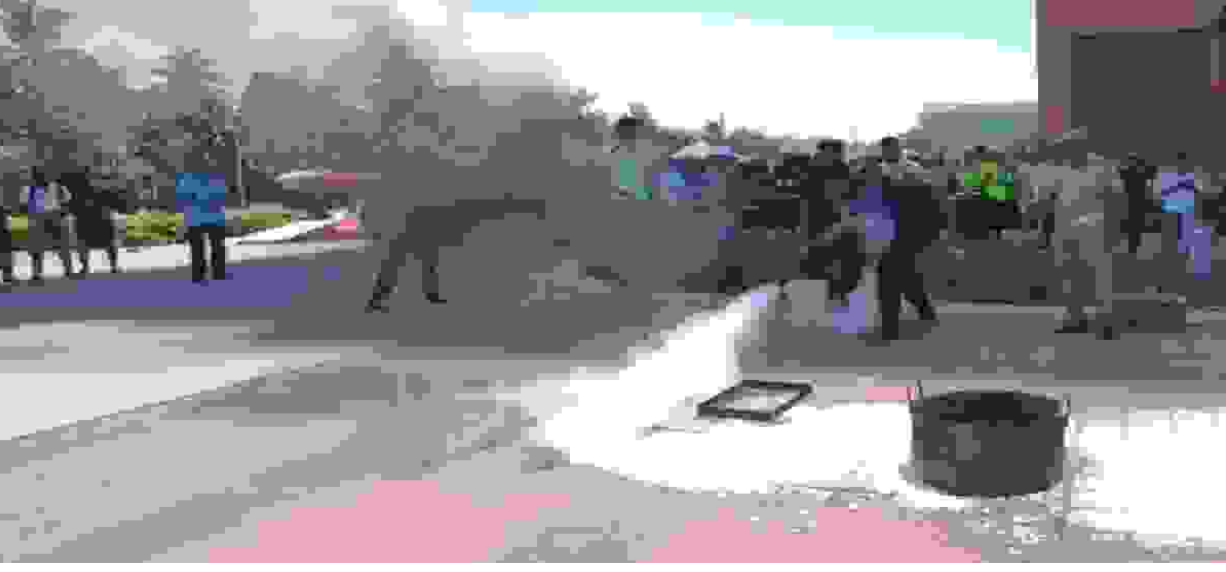
தீ விபத்து ஏற்படும் நேரங்களில் அதை எவ்வாறு கையாளுவது குறித்து ஒத்திகை நிகழ்ச்சி சென்னையில் நடைபெற்றது.

நுழைவுத் தேர்வு (நீட்) கடந்த மே 3-ம் நடைபெற்றது. ஆனால் அந்த தேர்வுக் கான வினாத்தாள் கள் தேர்வுக்கு முன்னரே கசிந்தது. அந்தத் தேர்வு செல்லாதென கடந்த மே 13 அன்று தேசியத் தேர்வு முகமை அறிவித்துள்ளது. அதனை யடுத்து அதே தேர்வு ஜூன் 21 அன்று மீண்டும் நடைபெறும் என அறிவிக்கப்பட்டுள்ளது. நீட் தேர்வே வேண்டாமென தொடக்கத் தலிருந்தே விசிக வலியுறுத்தி வருகிறது. இந்நிலையில் இதனைக் கண்டித்து, நீட் தேர்வு முறையை முற்றாகக் கைவிட வேண்டுமென வலியுறுத்தியும் தமிழகம் தழுவிய அளவில் தி.க. ஒடுங்கிணைக்கும் ஆர்ப்பாட்டங்களில் விடுதலைச் சிறுத்தைகள் கட்சியும் பங்கேற்கிறது. சென்னையில் விசிக சார்பில் நான் கலந்து கொள்கிறேன். இவ்வாறு அவர் கூறியுள்ளார்.