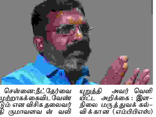
சென்னை: நீட் தேர்வை முற்றாகக் கைவிடவேண்டும் என விசிக தலைவர் திருமாவளவன் வலியுறுத்தி அவர் வெளியிட்ட அறிக்கை: இன்னிலை மருத்துவக் கல்விக்கான (எம்பிபிஎஸ்)

நுழைவுத் தேர்வு (நீட்) கடந்த மே 3-ம் நடைபெற்றது. ஆனால் அந்த தேர்வுக் கான வினாத்தாள் கள் தேர்வுக்கு முன்னரே கசிந்தது. அந்தத் தேர்வு செல்லாதென கடந்த மே 13 அன்று தேசியத் தேர்வு முகமை அறிவித்துள்ளது. அதனை யடுத்து அதே தேர்வு ஜூன் 21 அன்று மீண்டும் நடைபெறும் என அறிவிக்கப்பட்டுள்ளது. நீட் தேர்வே வேண்டாமென தொடக்கத் தலிருந்தே விசிக வலியுறுத்தி வருகிறது. இந்நிலையில் இதனைக் கண்டித்து, நீட் தேர்வு முறையை முற்றாகக் கைவிட வேண்டுமென வலியுறுத்தியும் தமிழகம் தழுவிய அளவில் தி.க. ஒடுங்கிணைக்கும் ஆர்ப்பாட்டங்களில் விடுதலைச் சிறுத்தைகள் கட்சியும் பங்கேற்கிறது. சென்னையில் விசிக சார்பில் நான் கலந்து கொள்கிறேன். இவ்வாறு அவர் கூறியுள்ளார்.