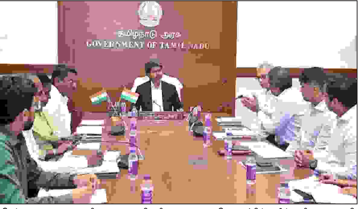
சென்னை: சீரான மின் விநியோகம் வழங்க வேண்டும், மின்வெட்டு குறித்து முன்சூட்டியே அறிவிக்க வேண்டும் என மின்வாரிய துறை அதிகாரிகளுக்கு முதலமைச்சர் விஜய் ஆலோசனை வழங்கியுள்ளார். தமிழக முதலமைச்சர் சி. ஜோசப் விஜய், தலைமை செயலகத்தில் பல்வேறு முக்கியத்துறை அதிகாரிகளுடன் இன்று தீவிர ஆலோசனை மேற்கொண்டார். அந்த வகையில், தமிழ்நாடு மின்வாரிய துறை அதிகாரிகளுடன் அவர் ஆலோசனையில் ஈடுபட்டார். இந்த ஆலோசனைக் கூட்டத்தில் பல்வேறு