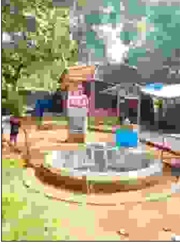
குமரி மாவட்டம் திற்பரப்பு சுற்றுலா தளம் கட்டையால் படகுத்துறை பகுதியில் மூடப்பட்டுள்ள கழிவறை. சுற்றுலா பயணிகளுக்கு மிகுந்த சிரமத்தை கொடுக்கிறது. காலதாமதம் செய்யாமல் விரைந்து நடவடிக்கை எடுக்க கோரிக்கை.