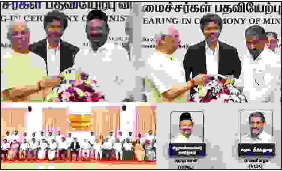
சென்னை: விளம்பு நிலையை சார்ந்தவர்கள் இரண்டு இடங்களை பெற்றிருந்- தாலும் கூட ஆட்சியில் பங்கேற்கும் வாய்ப்பு கிடைத்தது மகிழ்ச்சி அளிப்பதாகவும், தங்க- எது கனவு நனவாகி- யுள்ளதுகவும் விடுத- வைச் சிறுத்தைகள் கட்சியின் தலைவர்