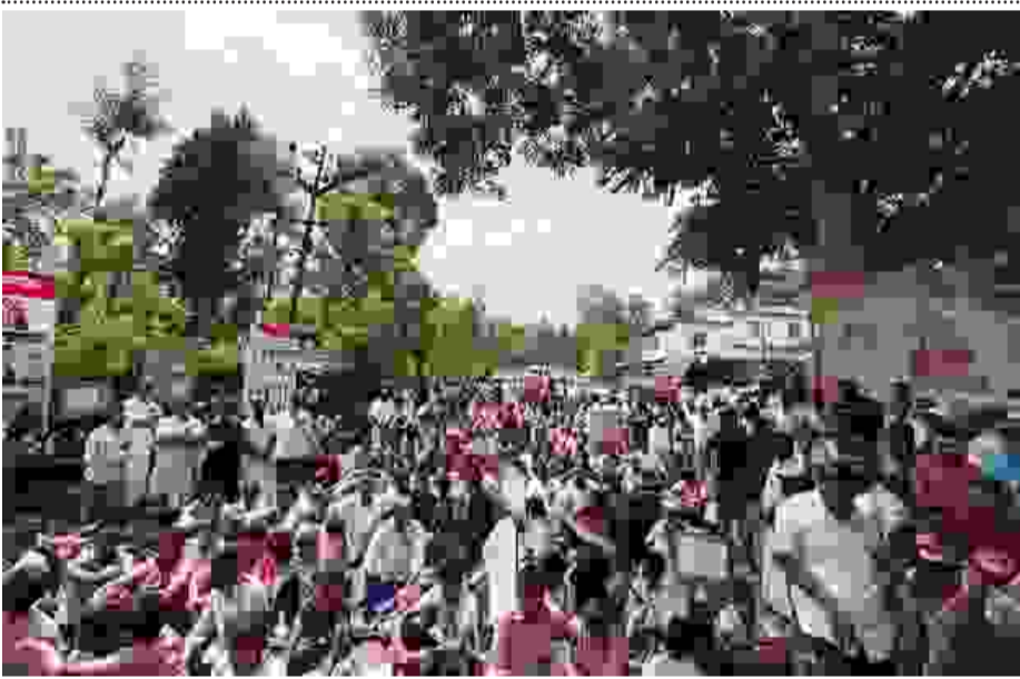
நீலகிரி மாவட்டம், கூடலூர் அருகே உள்ள முக்கட்டி, பாக்கணா பகுதியில், காட்டு யானை தாக்கி சிறுவன் உயிரிழந்த சம்பவத்தை தொடர்ந்து பொதுமக்கள் சாலை மறியலில் ஈடுபட்டு வருகின்றனர். மக்களின் பாதுகாப்பை உறுதி செய்யவும், காட்டு யானை அட்டகாசத்திற்கு நிரந்தர தீர்வு காணவும் அரசாங்கம் மற்றும் வனத்துறை உடனடி நடவடிக்கை எடுக்க வேண்டும் என பொதுமக்கள் கோரிக்கை...