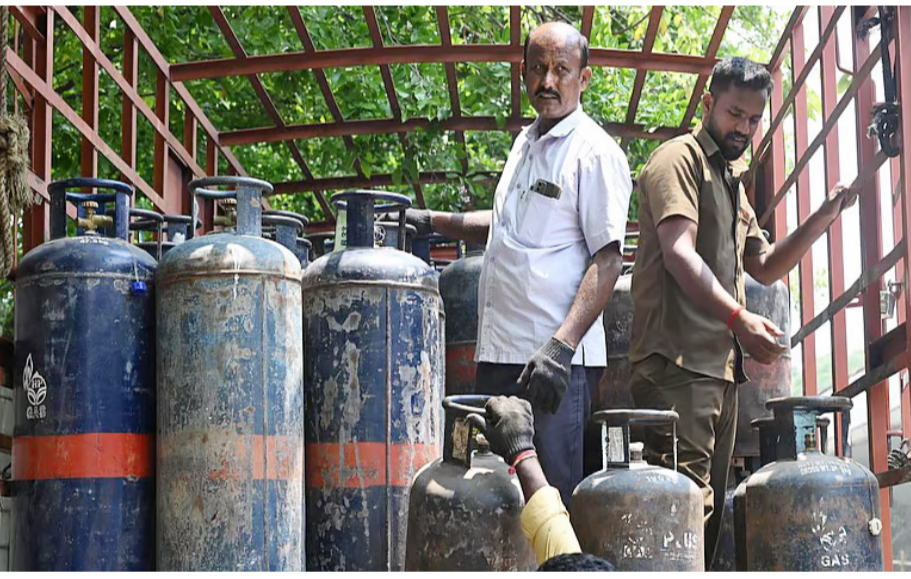
புது டெல்வி: 19 கிலோ எடை கொண்ட வணிக பயன்பாட்டுக்கான சிலிண்டர் விலை ரூ.42 உயர்த்தப்பட்டு ரூ.3113.50 ஆக நிர்ணயிக்கப்பட்டுள்ளது. சர்வதேச அளவில் கச்சா எண்ணெய்

விலையில் ஏற்படும் மாற்றங்கள் அடிப்படையில் வீட்டு உபயோக எரிவாயு சிலிண்டர் மற்றும் வணிக பயன்பாட்டுக்கான சமையல் எரிவாயு சிலிண்டர் ஆகியவற்றின் விலையை எண்ணெய் நிறுவனங்கள் அவ்வப்போது நிர்ணயித்து வருகின்றன. இதன்படி 19 கிலோ எடையுள்ள வணிக பயன்பாட்டிற்கான சமையல் எரிவாயு சிலிண்டர் விலை ரூ.42 உயர்த்தப்பட்டுள்ளது. இதன்படி 19 கிலோ எடை கொண்ட வணிக பயன்பாட்டிற்கான சமையல் எரிவாயு சிலிண்டர் விலை ரூ.3113.50 உயர்த்தப்பட்டுள்ளது. அதேபோல் 5